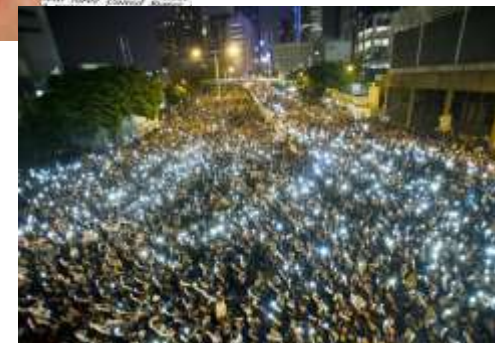
Manifestation avec smartphone à Hong Kong